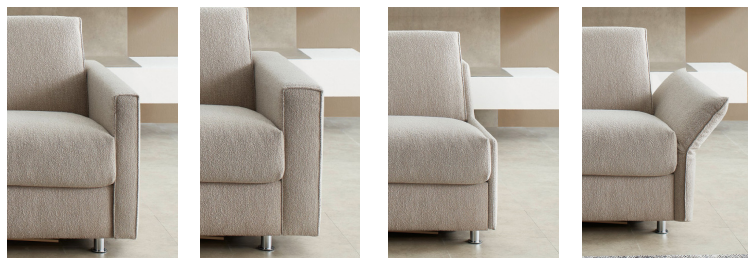
Armlehne Typ 1